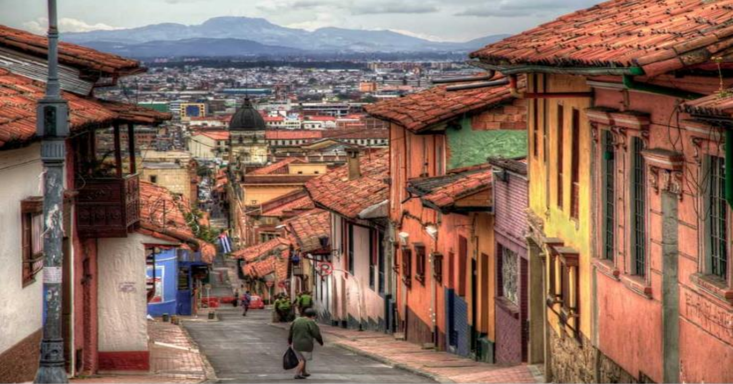
Calles de La Candelaria. En el Flickr de szeke.