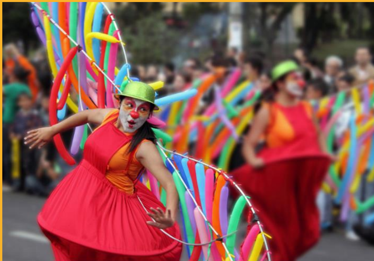
Festival Iberoamericano de Teatro de Bogotá.